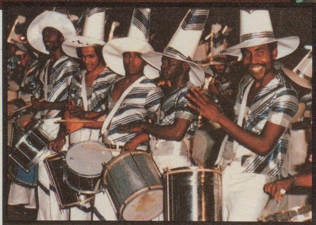
Bahia. Wo man das Lied singt «Ei, ei, ei Maria», dort wächst rassiger Kakao.