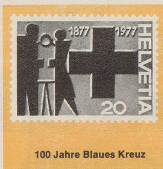
100 Jahre Blaues Kreuz