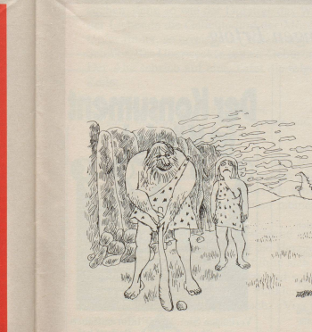
«Gib mir den andern Schläger!»