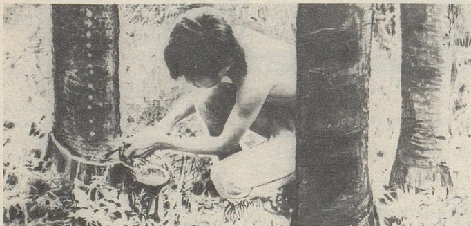
In Siam wird aus Einschnitten in die Stamrinde einer Styracaceae ein wichtiger Bestandteil des Zellerbalsam gewonnen.

Es stimmt nicht, dass die brandschatzenden und mordenden Terrorkommandos die Verantwortung für ihre Verbrechen übernehmen, wie sie es jeweils nach erfolgter Schandtat zynisch verkünden. Mord ist immer verantwortungslos. Schtächmugge