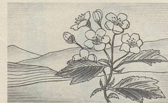
Crataegus, eine der Heilpflanzen, deren Extrakte in Zellers Herz- und Nerventropfen enthalten sind.

Zellerbalsam bewährt sich nun bereits seit über hundert Jahren. Er ist jetzt auch in Tablettenform erhältlich.