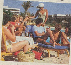
Jeder hat seine Ferien-Erinnerungen.