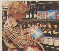
Wer die Wahl hat... (CAMPARI ist immer richtig.)