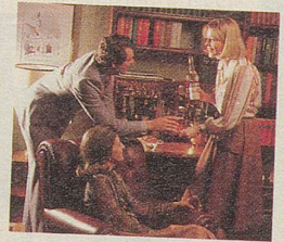
CAMPARI – oder gibt es eine nettere Begrüssung?