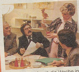
CAMPARI – damit die Woche in Schuss kommt. (Eine gute Sekretärin kann mehr als Kaffee-kochen.)