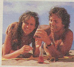
CAMPARI Soda, da ist man gleicher Meinung.