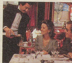
CAMPARI Bitter – der Aperitif.