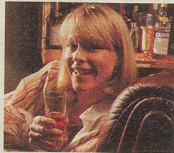
CAMPARI Bitter. Für Leute, die ihr Zuhause geniessen.