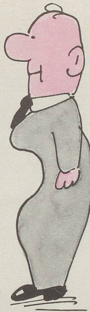
... aber kein Bauch auch nicht