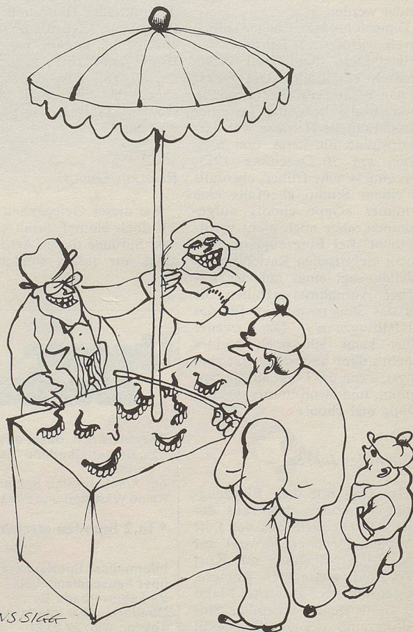
Zahnpflege: heute für jedermann erschwinglich.