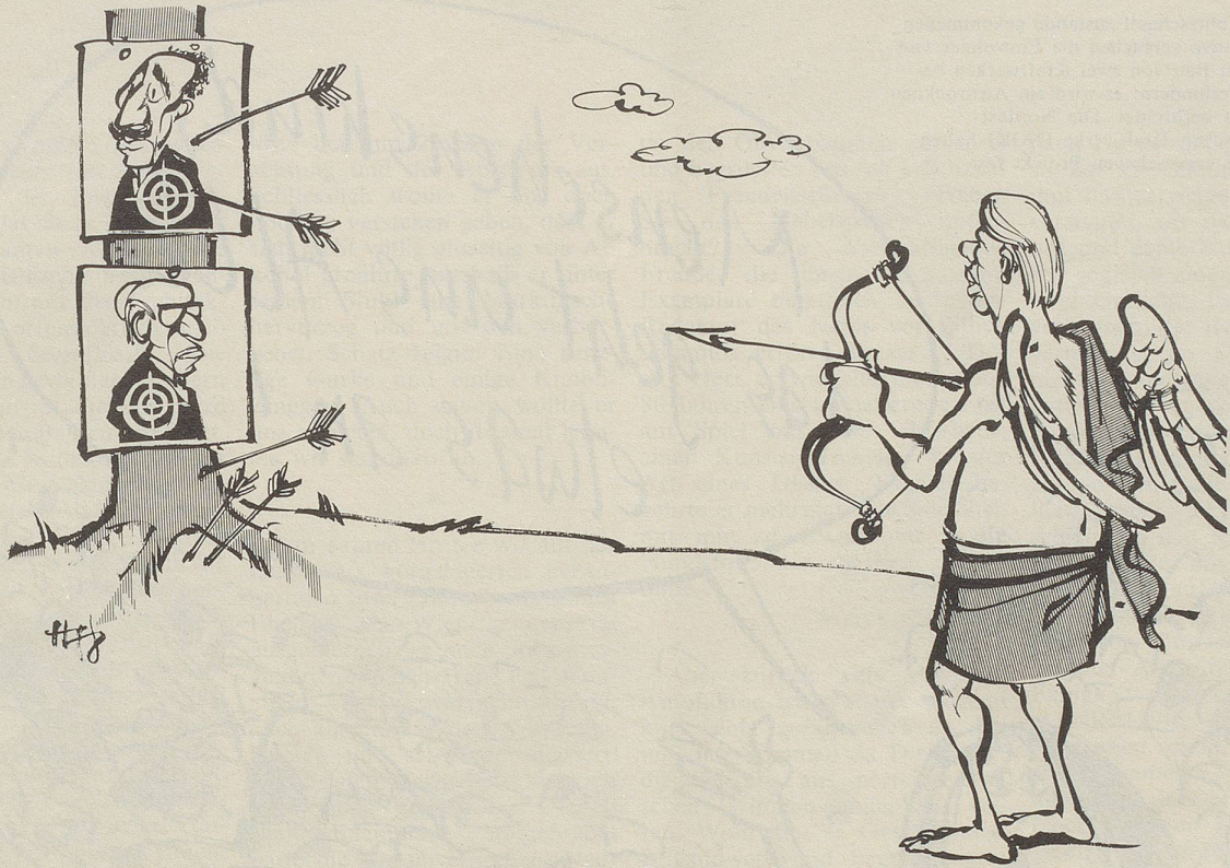
Amor in vorläufiger Bestform

Die Volksrepublik China will Tausende seiner Abiturlanten auf westliche Universitäten schicken.