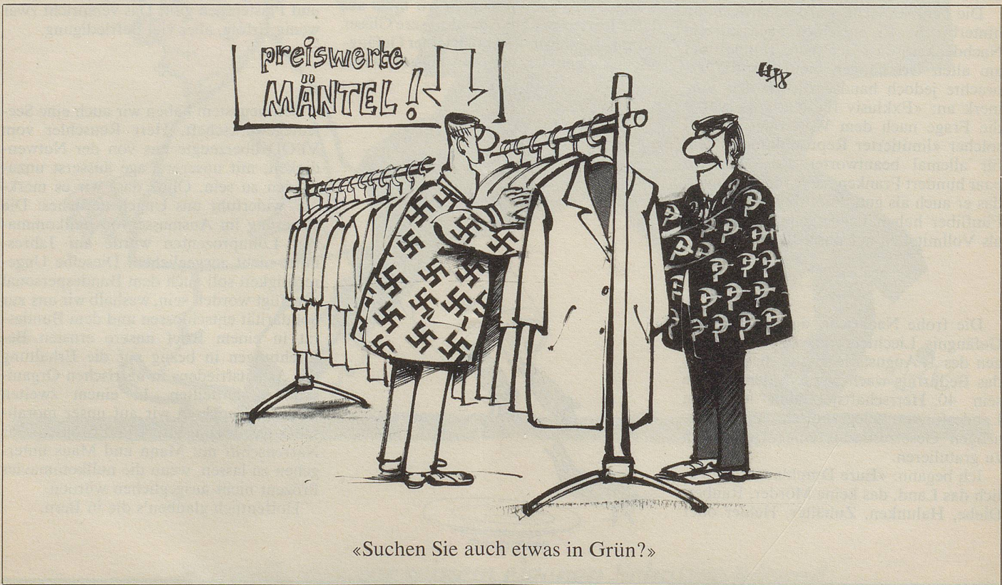
«Suchen Sie auch etwas in Grün?»