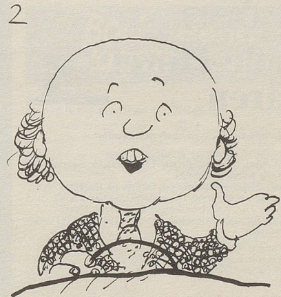
... ich fahre verhalten und bin rücksichtsvoll anderen Automobilisten gegenüber ...