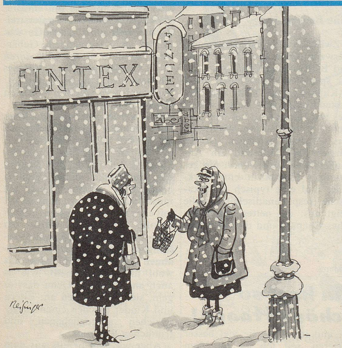
«Mein Mann liebt nun einmal naturgekühltes Bier!»

Es gibt ja auch wichtigere Dinge als Pfeilleuchten. UH