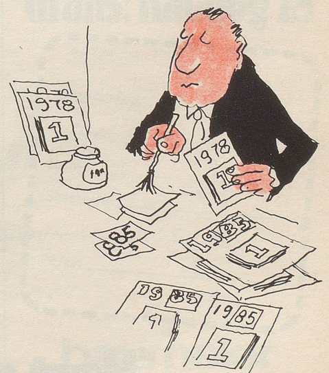
5 Oder aber die Kalendarien für 1978 werden umkorrigiert in solche für 1979 und dann verschenkt.