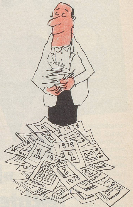
4 Oder man trennt nur die Kalenderblätter mit dem Datum des 1. August heraus, weil es nie zu früh ist, an den Nationalfeiertag zu denken.