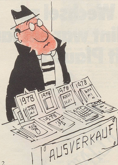
2 ... könnte man die Zeit der Ausverkäufe nützen und die Sammlung zu Schleuderpreisen absetzen ...