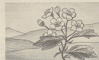
Crataegus, eine der Heilpflanzen, deren Extrakte in Zellers Herz- und Nerventropfen enthalten sind.

Zellerbalsam bewährt sich nun bereits seit über hundert Jahren. Er ist jetzt auch in Tablettenform erhältlich.