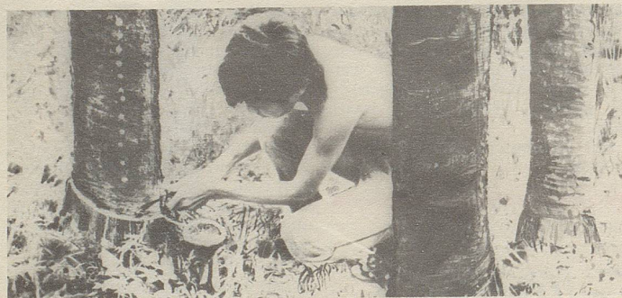
In Siam wird aus Einschnitten in die Stamrinde einer Styracaceae ein wichtiger Bestandteil des Zellerbalsam gewonnen.

ten wie z. B. «Présence de Nestlé dans les pays en développement» und «Die Säuglingsernährung in der Dritten Welt: Einige Gedanken zum Beitrag von Nestlé» können mithelfen, das völlig falsche Bild, wie es von der «Arbeitsgruppe Dritte Welt» und deren leichtgläubigen Mitläufern präsentiert wird, zu korrigieren. Die Lektüre dieser Schriften kann ich Ihnen bestens empfehlen. H. U. Bohren, St-Légier