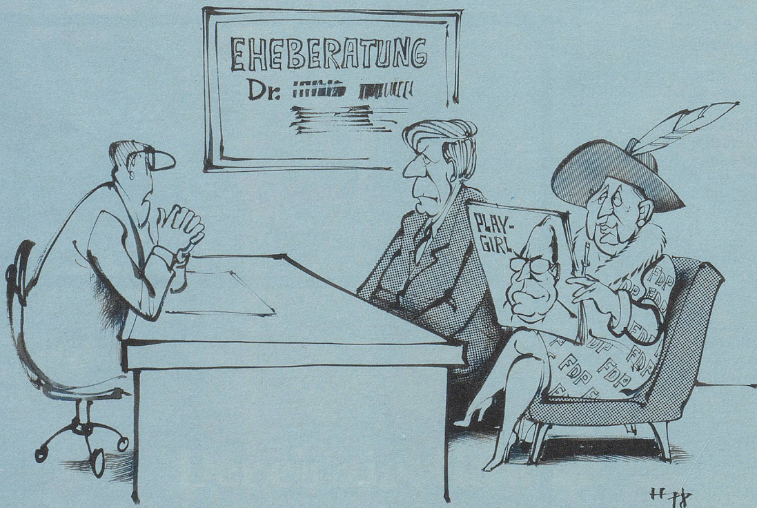
«Sie müssen sich langsam darauf vorbereiten, dass Ihre Gattin in die Wechseljahre kommt!»