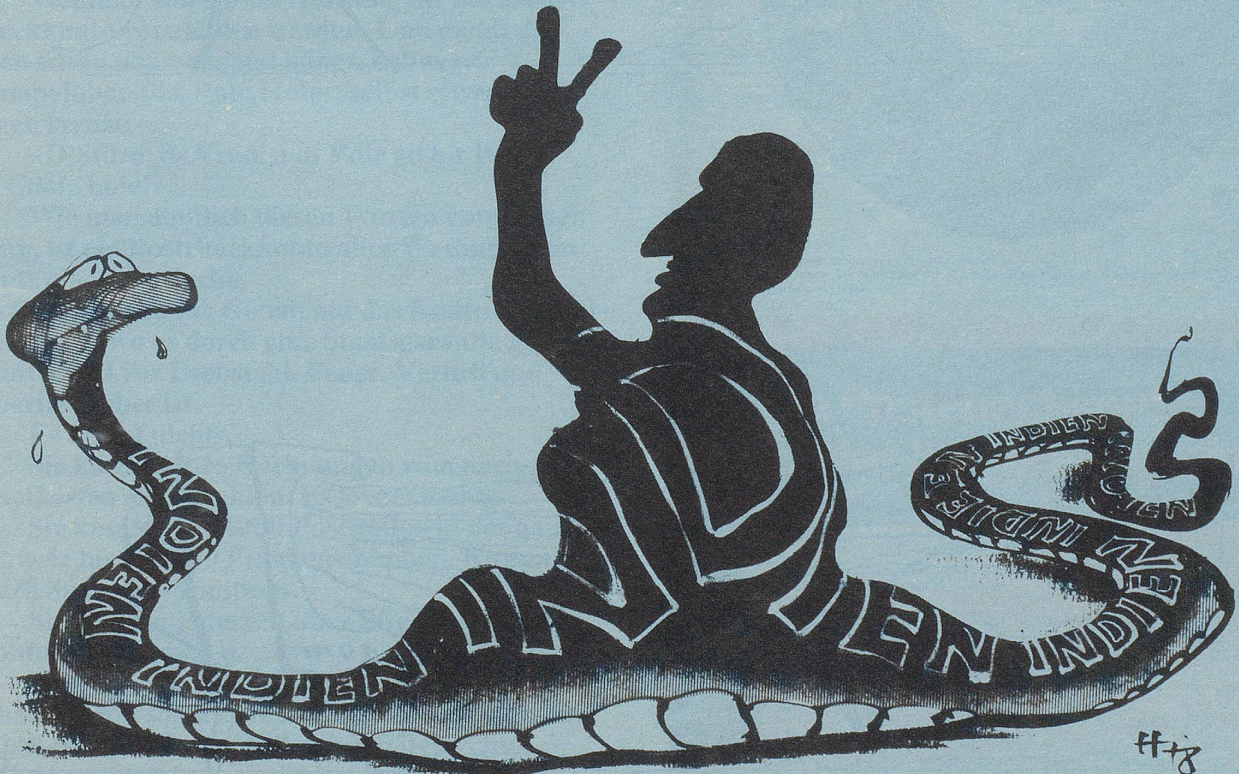
Jeder denkt die ist perdü! —, aber nein! — noch lebet sie! (Busch)

Indira Gandhi gewinnt die Regionalwahlen im indischen Bundesstaat Karnataka