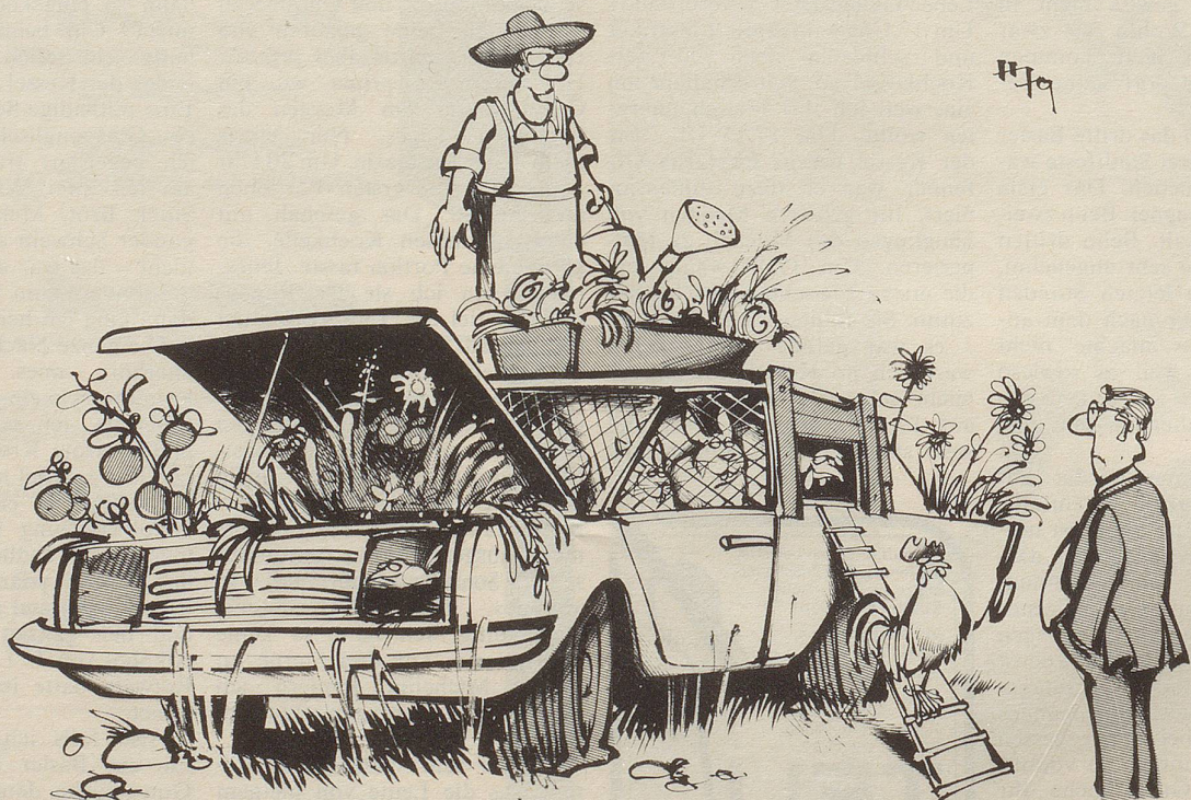
«Ich bin nur der Zeit etwas voraus ...!»