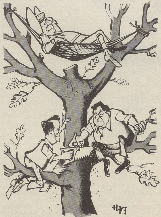
Wenn zwei sägen ...