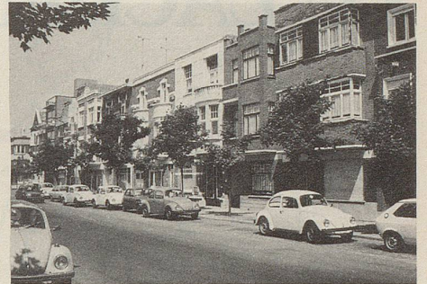
... steht in starkem Kontrast zum alten Kern des Städtchens.