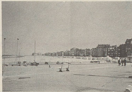
Der lange Strand von Knokke...

Das alles also in Knokke-Heist, einem seit langem berühmten und mondänen Badeort an der Nordsee mit rund 27 000 Einwohnern, die sich während der Saison um einige tausend vermehren. Es soll das teuerste Seebad der dortigen Küste sein, was man als Besucher