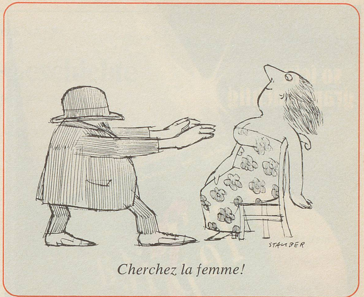
Cherchez la femme!