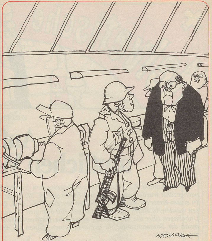
«Ich habe immer das Gefühl, mein Arbeitsplatz sei in Gefahr, Herr Direktor.»