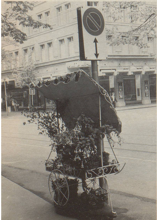
Hier vermissen wir den wichtigen Hinweis: «Ausser für Blumen-Cabriolets.»