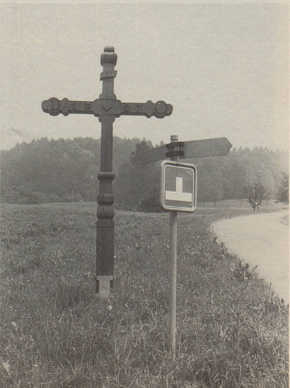
Kirche in der Sackgasse? Eine etwas gewagte Anordnung.