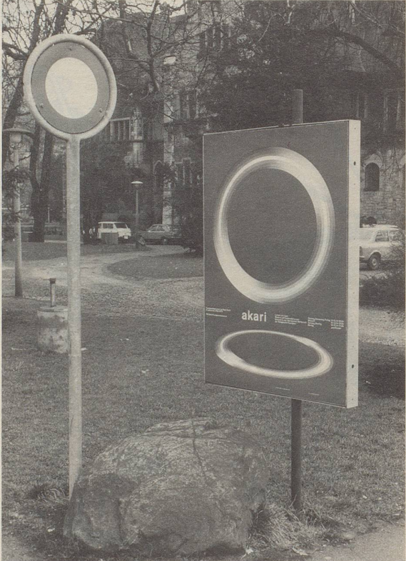
Verkehrszeichen sollen, so fordert der Heimatschutz, wenn immer möglich auf die Umgebung abgestimmt werden. Hier ist das in optimaler Weise gelungen.