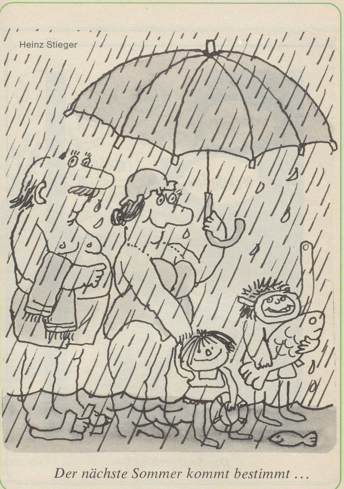
Der nächste Sommer kommt bestimmt ...