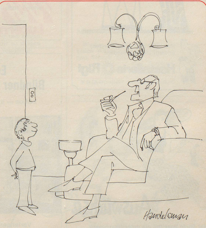
«Gewiss, Grossvater war in seiner Jugend ein «irrer Gei», aber Gott bewahre nicht in dem Sinn, wie du das verstehst!»