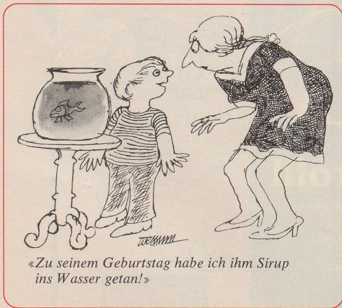
«Zu seinem Geburtstag habe ich ihm Sirup ins Wasser getan!»

Ein jüngerer SBB-Mann erschien, öffnete einen Wandschrank und rumorte darin herum. «Hattest du Erfolg?» fragte