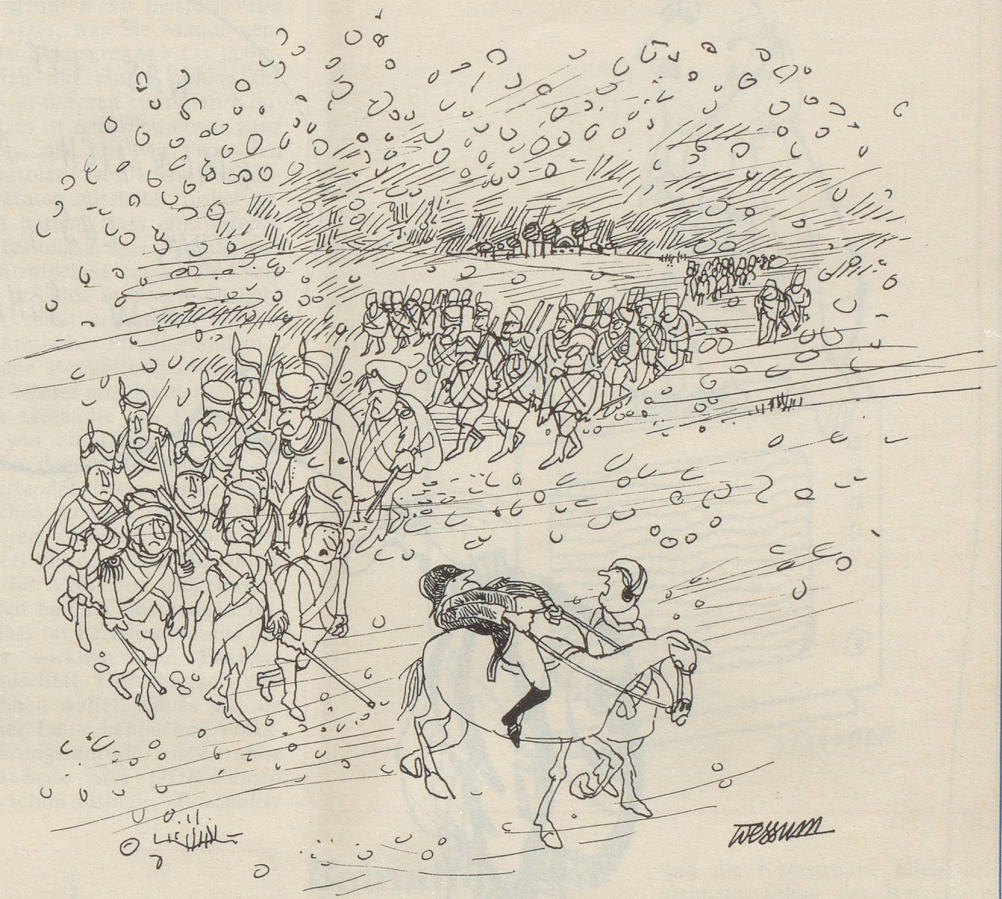
«Der Mann beim Chef? Das kann wohl nur sein Psychiater sein!»

Erleichtert, wenn auch noch etwas wacklig auf den Beinen, machte ich mich davon, bestärkt in der Ansicht, dass Gesundheit und Freiheit die höchsten Güter des Menschen bedeuten. Trotzdem kann ich mich ihrer nicht so recht erfreuen. Ich werde nach dieser Episode das eigenartige Gefühl nicht los: Irgendetwas fehlt mir – es könnte mir da im Spital vielleicht etwas abhanden gekommen sein. Ich weiss zwar nicht genau was. Aber ich werde schon noch dahinterkommen!