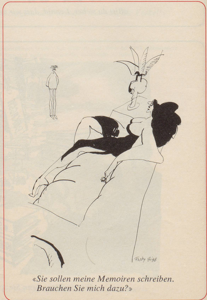
«Sie sollen meine Memoiren schreiben. Brauchen Sie mich dazu?»