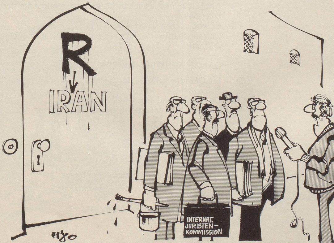
«... und zu welchem Ergebnis haben Ihre Untersuchungen geführt?»