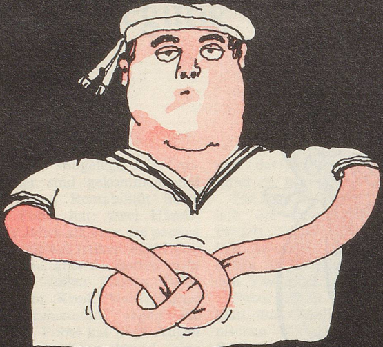
◦ Halber Schlag ◦