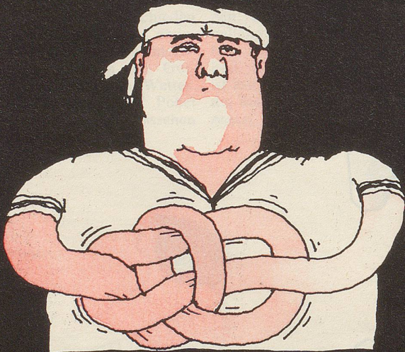
◦ Pahlstek ◦