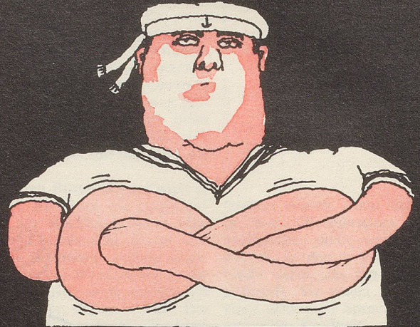
◦ Achtknoten ◦