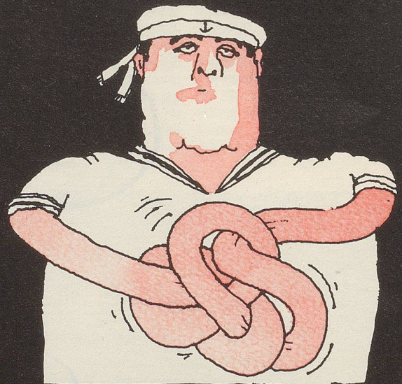
◦ Laufender Pahlstek ◦