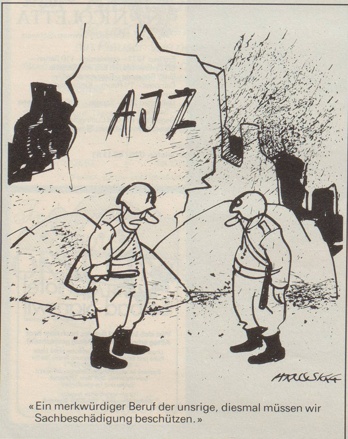
«Ein merkwürdiger Beruf der unsrige, diesmal müssen wir Sachbeschädigung beschützen.»