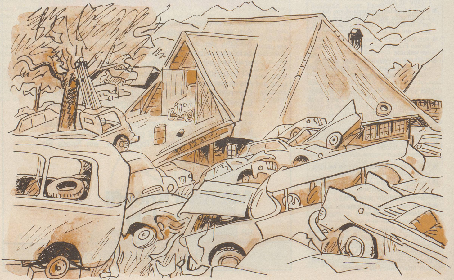
Schrottenflüe bei Isenberg