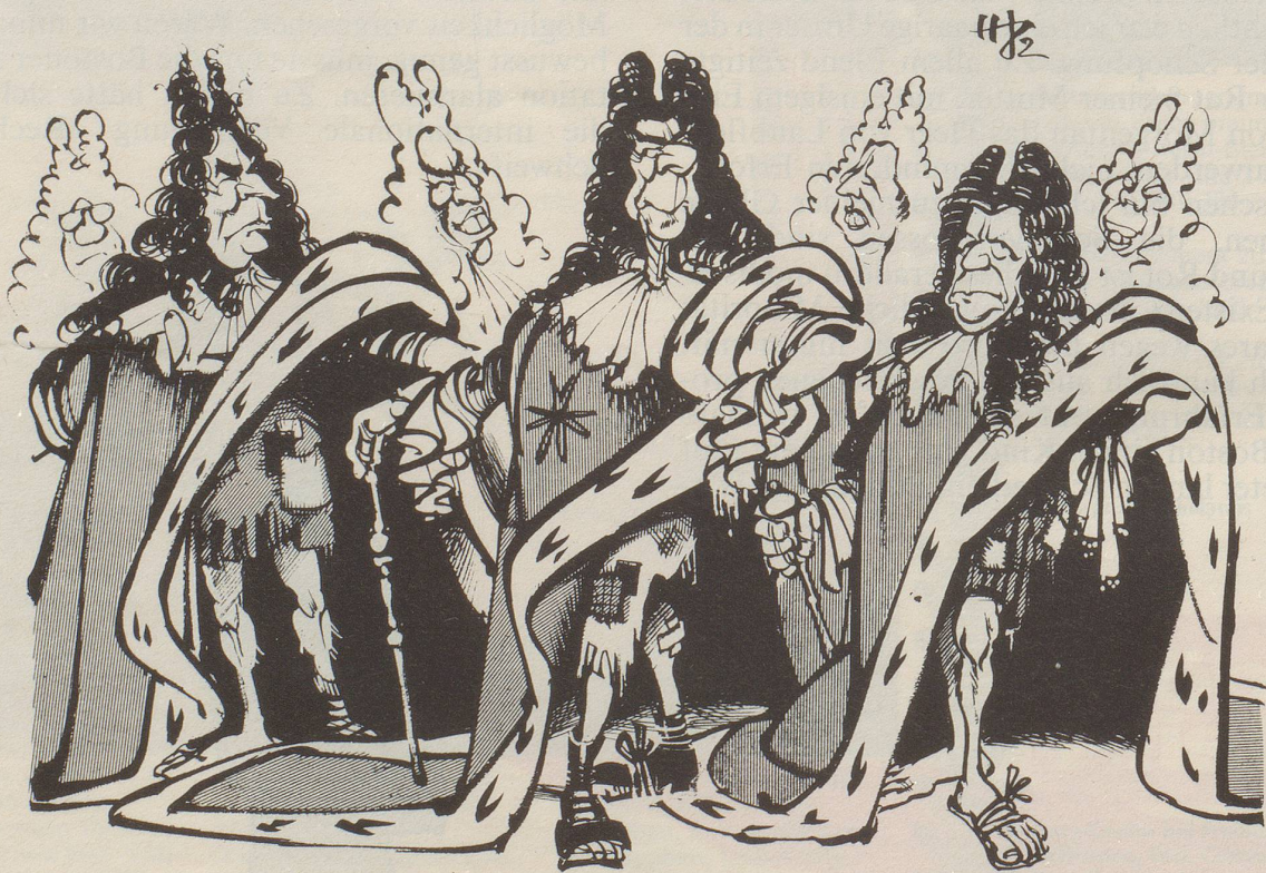
Die Majestäten von Versailles