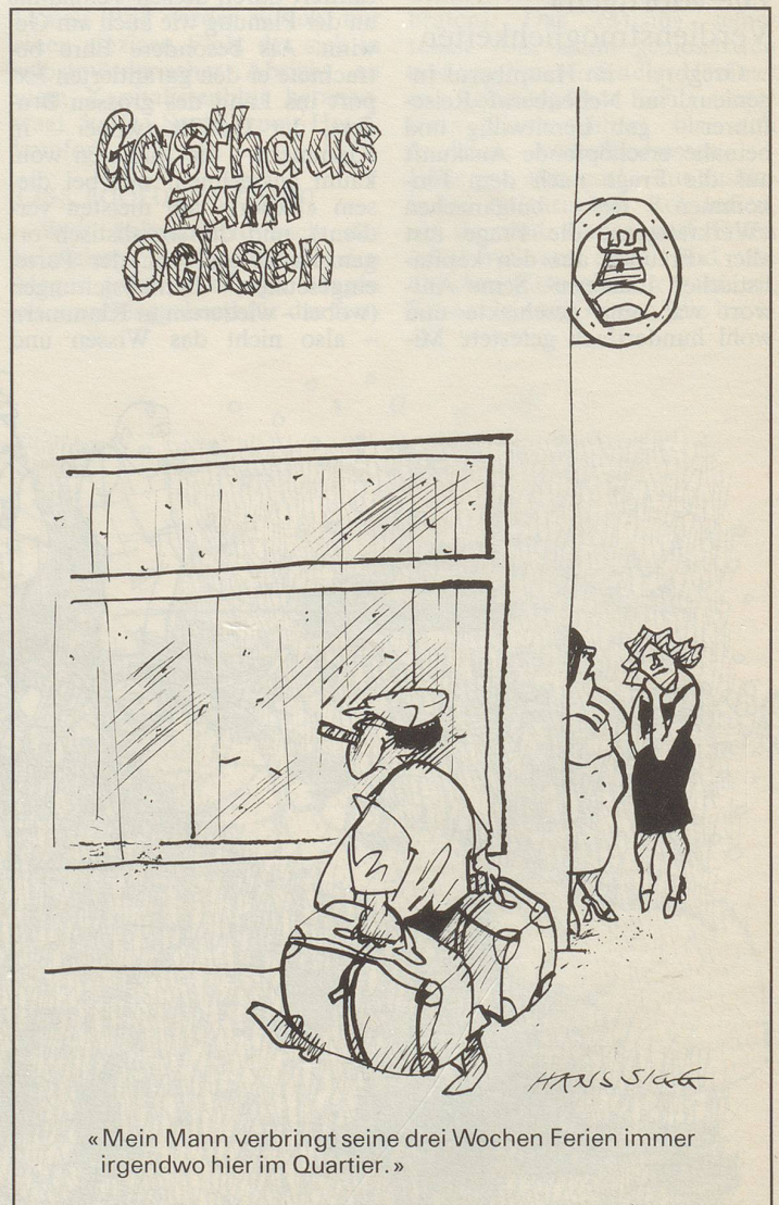
«Mein Mann verbringt seine drei Wochen Ferien immer irgendwo hier im Quartier.»