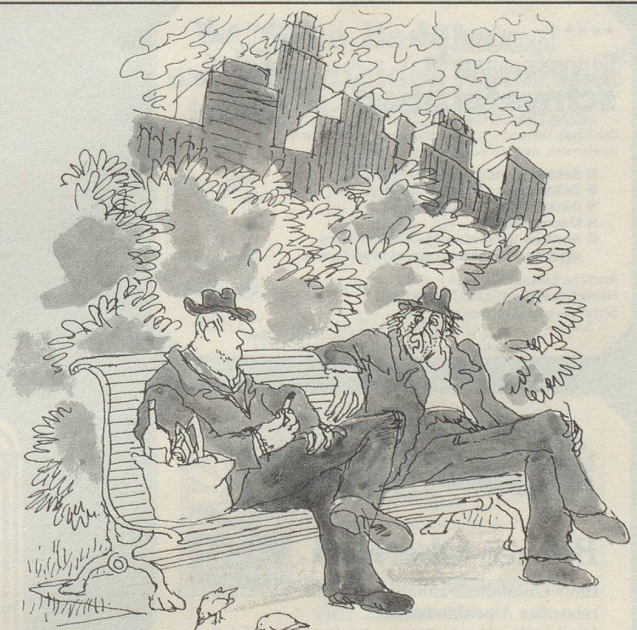
«Dann dachte ich: Zum Teufel mit den Aktien! Und investierte fortan nur noch in Schnaps.»

Seither wundert sich die Welt, dass die Friedenstauben plötzlich als ausgestorben gelten.