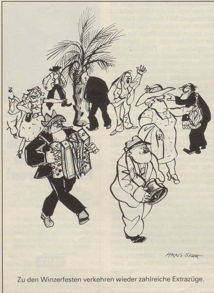
Zu den Winzerfesten verkehren wieder zahlreiche Extrazüge.