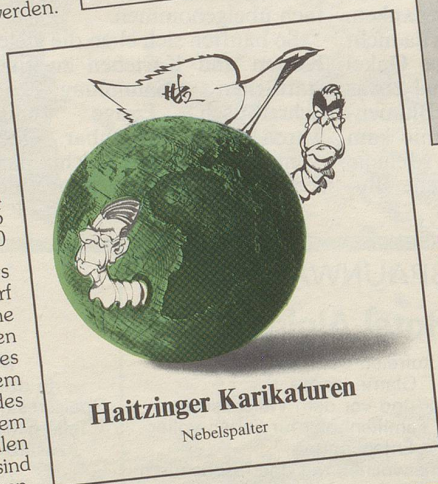
Haitzinger Karikaturen Nebelspalter

Horst Haitzingers geistreich-scharf formulierte politische Karikaturen, versehen mit dem Datum des Ereignisses, bzw. dem Datum des Tatbestandes und mit einem treffsicheren verbalen Kurzkomentar, sind stets aktualitätsbezogen.