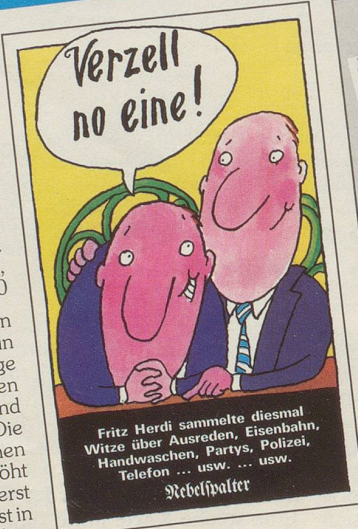
Fritz Herdi sammelte diesmal Witze über Ausreden, Eisenbahn, Handwaschen, Partys, Polizei, Telefon ... usw. ... usw. Nebelspalter

Die Witze in diesem Bändchen sind thematisch wiederum in alphabetischer Reihenfolge geordnet, wie bei den Vorgängern «Kännsch dä?» und «Häsch dä ghört?». Die Vergnüglichkeit der einzelnen Witze wird erheblich erhöht dadurch, dass sie äusserst mundgerecht – nämlich meist in Mundart – dargeboten werden.