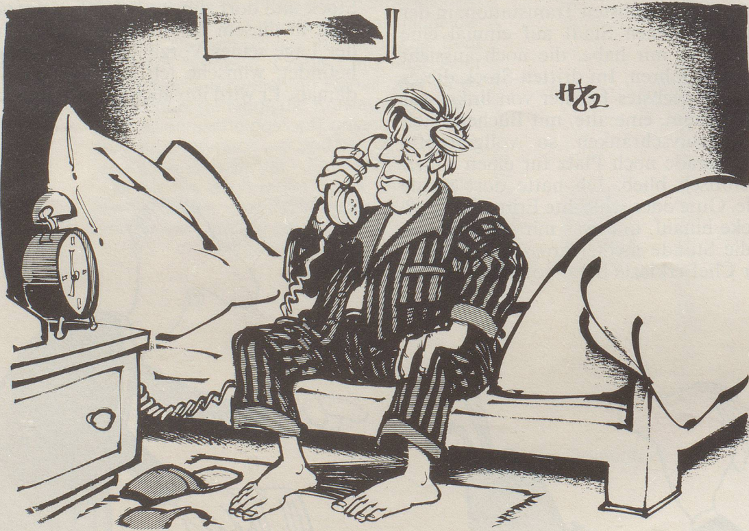
«Wie ist es, Genscher, machen wir heut' noch mal?»