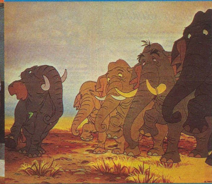
Elefantenschule Tellspiele Cellist Yö-Yö Ma