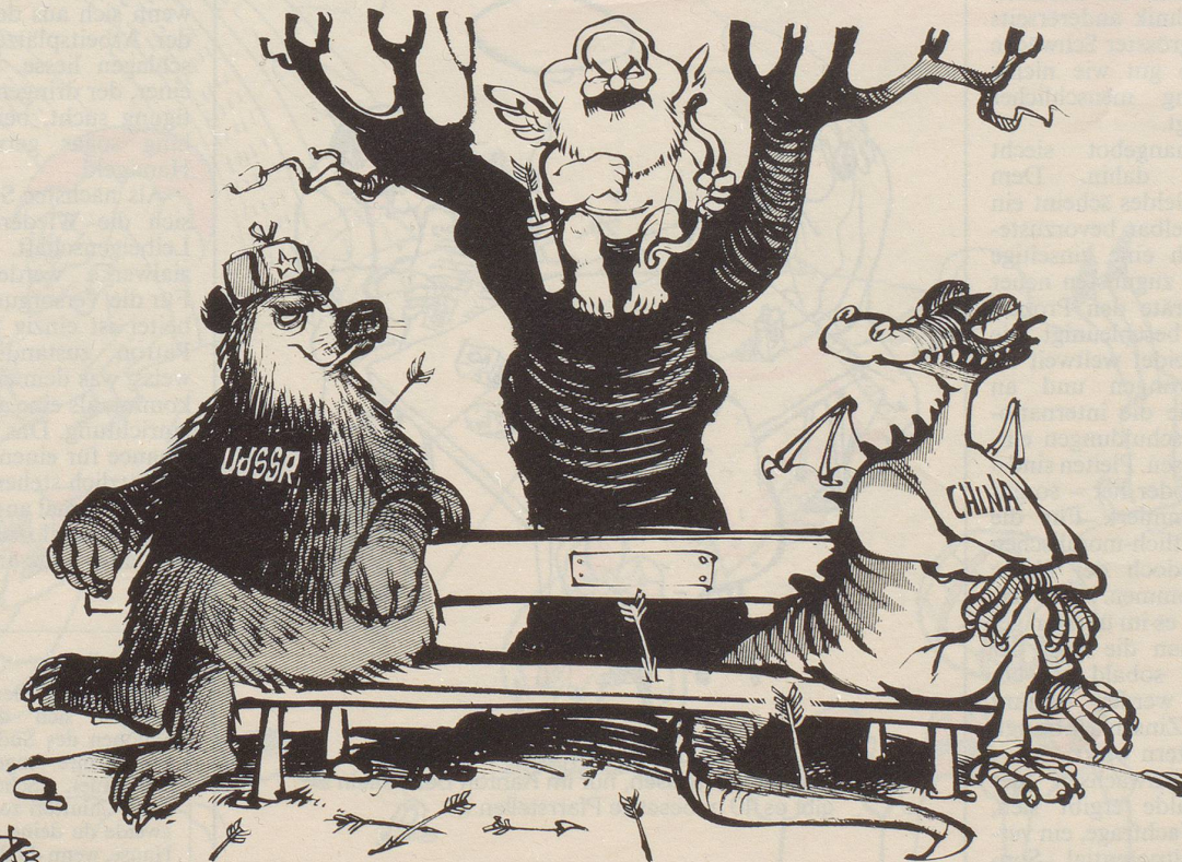
Love story 1983?