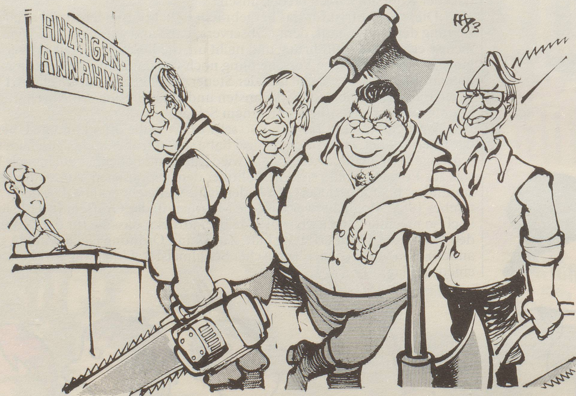
«... Glacéhandschuhe, kaum gebraucht, billig abzugeben ...»