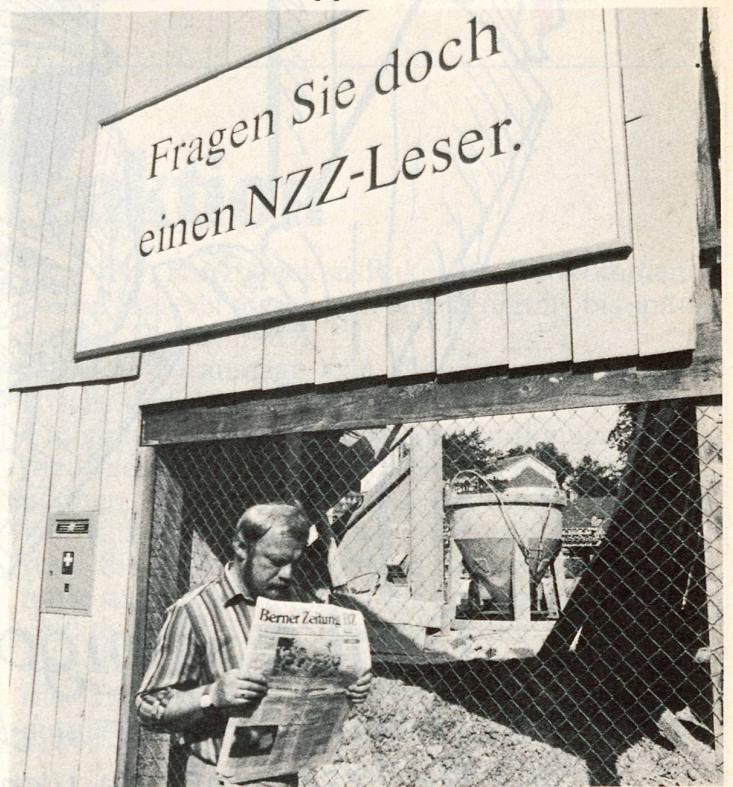
Bern bleibt Bern ...