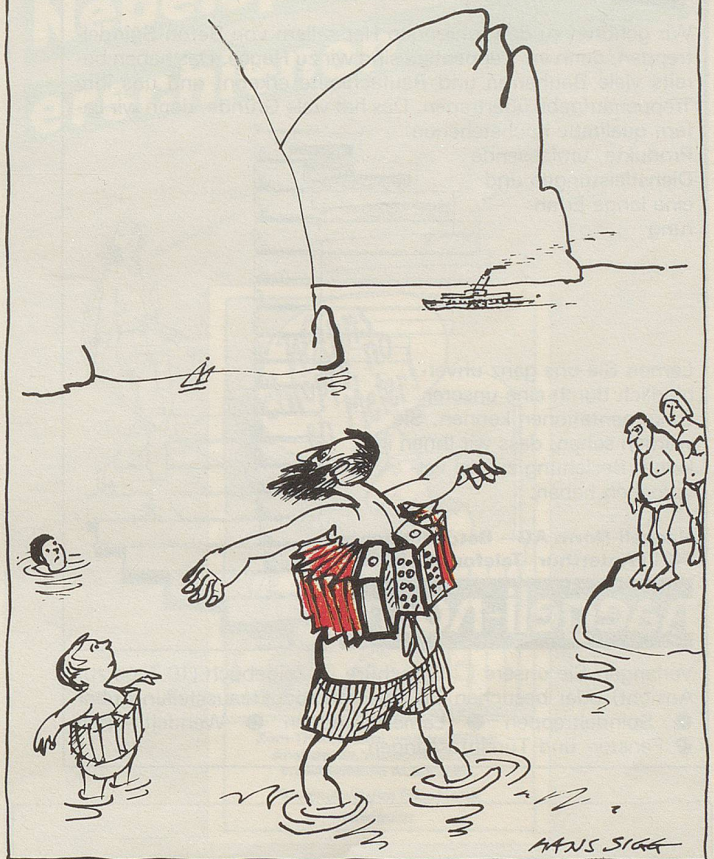
Anfänger auf dem Vierwaldstättersee

Ein Kunstfreund fragt in einer Galerie: «Ist dieses Bild denn wirklich von Hodler?» Antwort des Galeristen: «Mindestens Hodler!»