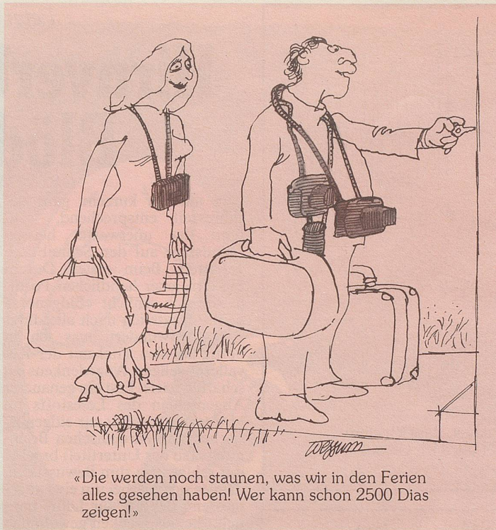
«Die werden noch staunen, was wir in den Ferien alles gesehen haben! Wer kann schon 2500 Dias zeigen!»

Als ich nachher zerkratzt und wehen Rückens auf dem Mäuerchen sass, kam mir das Insetat wieder in den Sinn. Kritisch musterte ich unser Haus. Ob sich nicht die grosse Waschküche und der unbenützte Kohlenkeller in eine Zwei-Zimmer-Wohnung umfunktionieren liessen? Gar-