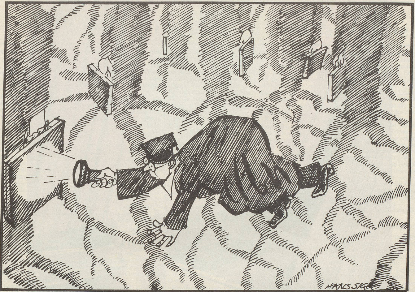
Der Spezialist für internationale Wirtschaftskriminalität