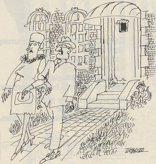
«Das sind Snobs: Hummer im Gartenteich!»

Ich fange an, mich zu schämen, aber nur ein bisschen, denn schliesslich schlepe ich die Papiermengen vom Estrich herunter, bündle sie und stelle sie an den Strassenrand! Uschi