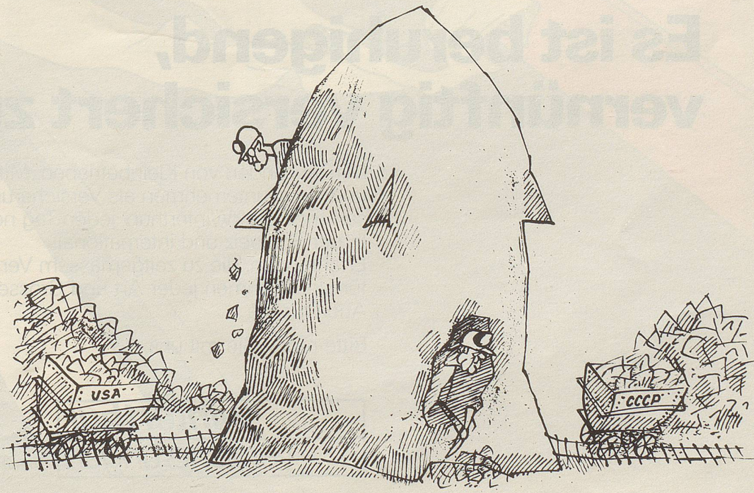
Durchbruch in Genf?

Wenn die Edelkastanien diesen Herbst so schön werden wie die Rosskastanien, dann werden die Marroni-Brater einen feinen Winter und zufriedene Kunden haben. Und sollte der Winter doch zu hart werden, dann könnte man mit einem warmen Orientteppich von Vidal an der Bahnhofstrasse 31 in Zürich etwas für warme Füsse tun.