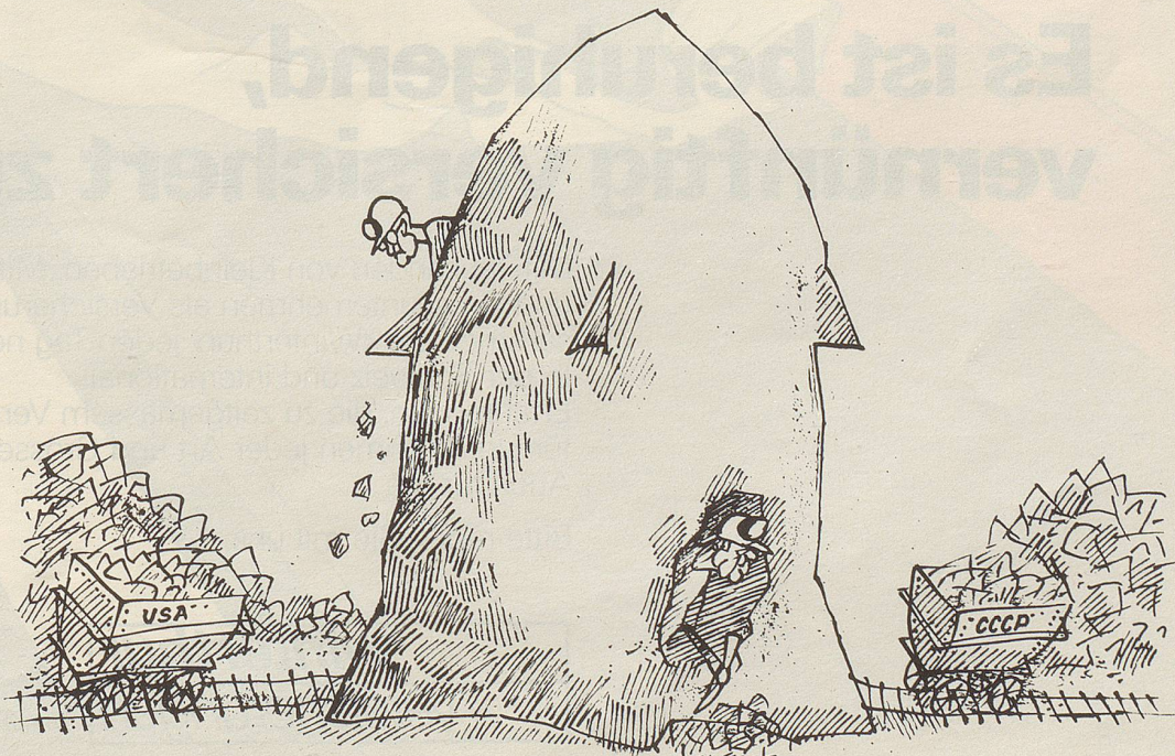
Durchbruch in Genf?

Wenn die Edelkastanien diesen Herbst so schön werden wie die Rosskastanien, dann werden die Marroni-Brater einen feinen Winter und zufriedene Kunden haben. Und sollte der Winter doch zu hart werden, dann könnte man mit einem warmen Orientteppich von Vidal an der Bahnhofstrasse 31 in Zürich etwas für warme Füsse tun.