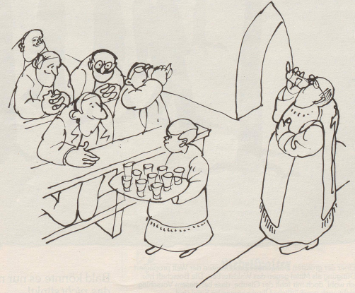
Das Abendmahl wieder ernster nehmen.