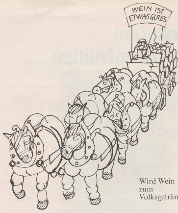
Wird Wein zum Volksgetränk?