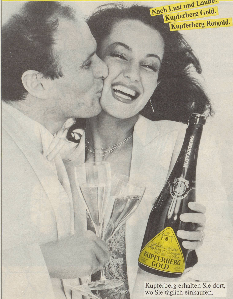
Kupferberg erhalten Sie dort, wo Sie täglich einkaufen.

Nach Lust und Laune: Kupferberg Gold, Kupferberg Rotgold.