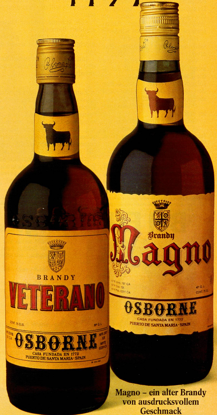
Veterano – der Brandy mit dem gewissen Etwas