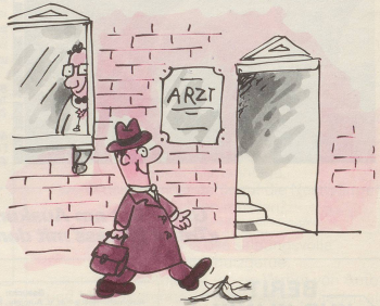
3 Der eine oder andere Arzt wird, um zu überleben, unkonventionelle Arbeitsbeschaffungsmethoden anwenden müssen.