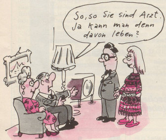
1 Ansehen und Einkommen der Ärzte werden sich verändern.