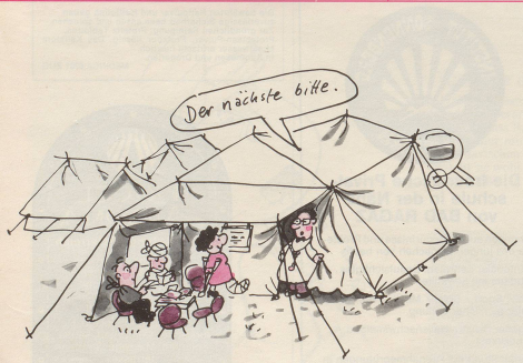
2 Nicht mehr alle Ärzte werden eine bezahlbare Praxis finden.