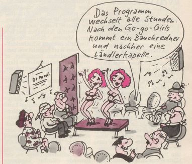
6 Attraktionen, Konzerte etc. im Wartezimmer ...