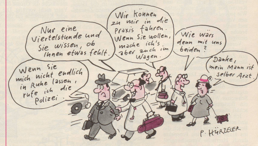
7 ... oder aber auch durch Strassenarbeit.