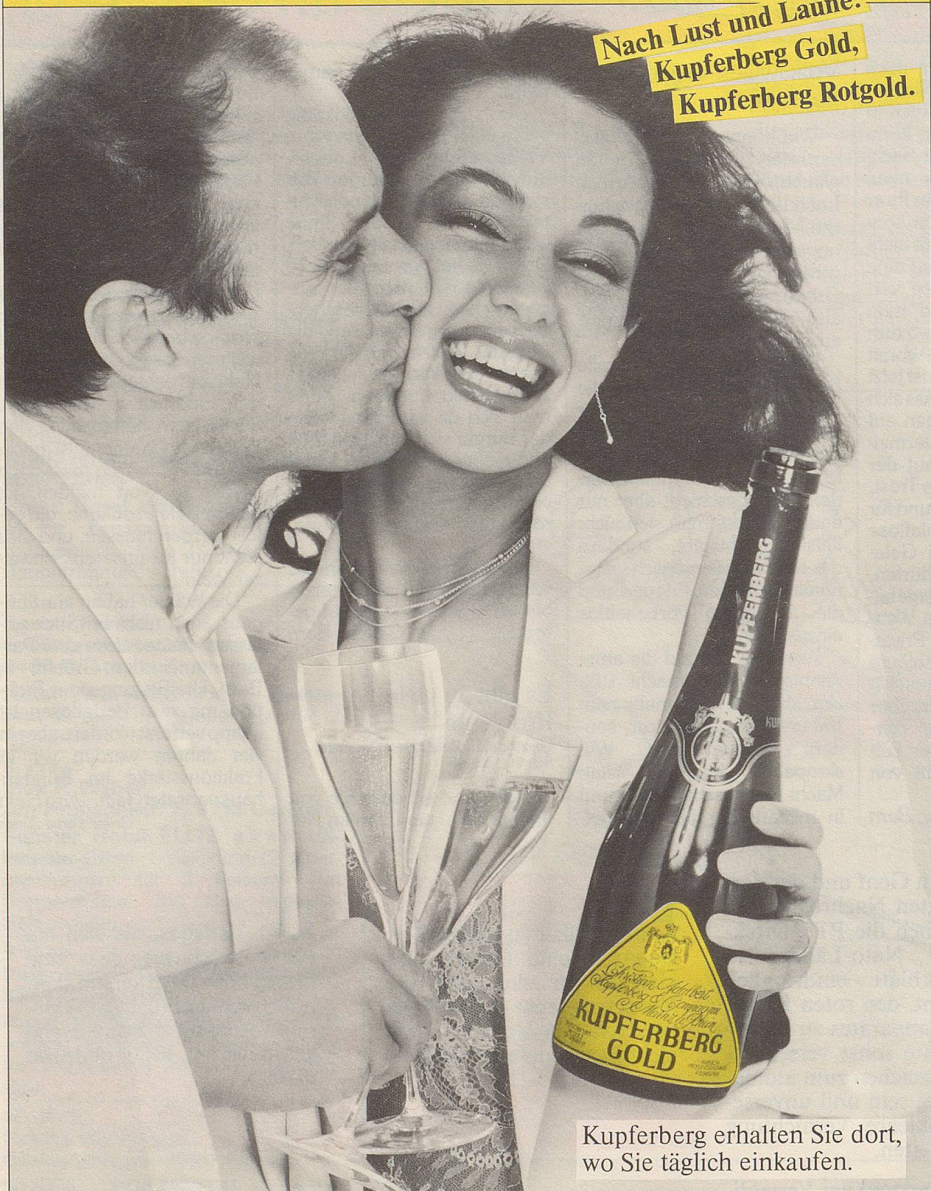
Kupferberg erhalten Sie dort, wo Sie täglich einkaufen.

Nach Lust und Laune: Kupferberg Gold, Kupferberg Rotgold.