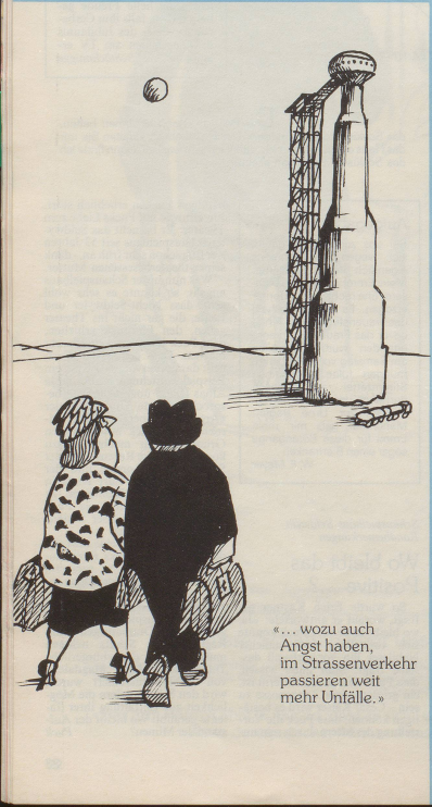
«... wozu auch Angst haben, im Strassenverkehr passieren weit mehr Unfälle.»