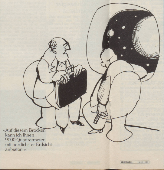
«Auf diesem Brocken kann ich Ihnen 9000 Quadratmeter mit herrlichster Erdsicht anbieten.»