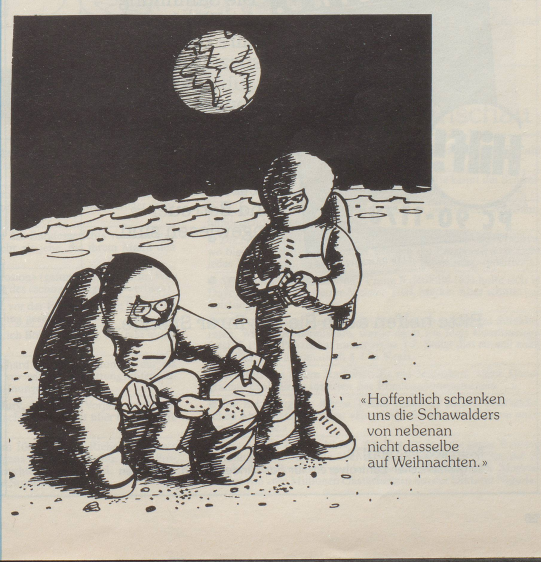
«Hoffentlich schenken uns die Schawalders von nebenan nicht dasselbe auf Weihnachten.»