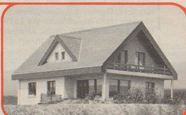
W/ZM • Biel

• «Bautec»-Schönheit: Der Katalog * zeigt's – urteilen Sie selbst!